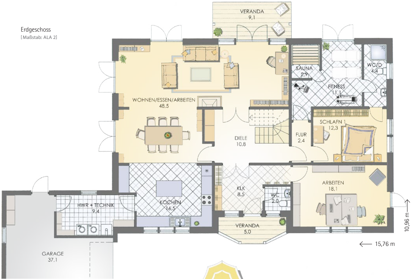
Erdgeschoss [Maßstab: ALA 2]