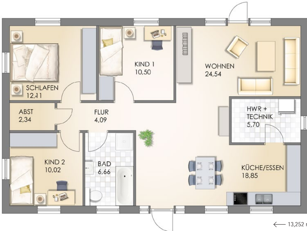
Grundriss [Maßstab: ALA 1]